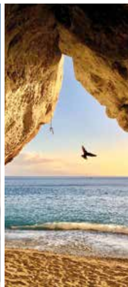
DAL CIELO E DAL MARE