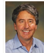
Gerald Joyce

La capacità di un DNA a singolo filamento di apparirsi specificamente con la sua sequenza complementare è essenziale per una replicazione accurata dell'informazione codificata. Gli scienziati si sono anche resi conto del fatto che l'appaiamento delle basi è una proprietà estremamente utile per assemblare diverse strutture tridimensionali del DNA, con scopi diversi che possono andare dal rinchiudere in una capsula e trasportare fino alla destinazione sostanze farmaceutiche fino all'informatica basata sul DNA. Il trucco consiste nel controllare le interazioni di appaiamento tra le basi per favorire la formazione delle conformazioni desiderate. Una sfida particolare consiste nel progettare sequenze che possano essere clonate e copiate dalle DNA polimerasi nelle cellule e che possano anche da sole assumere specifiche conformazioni tridimensionali.