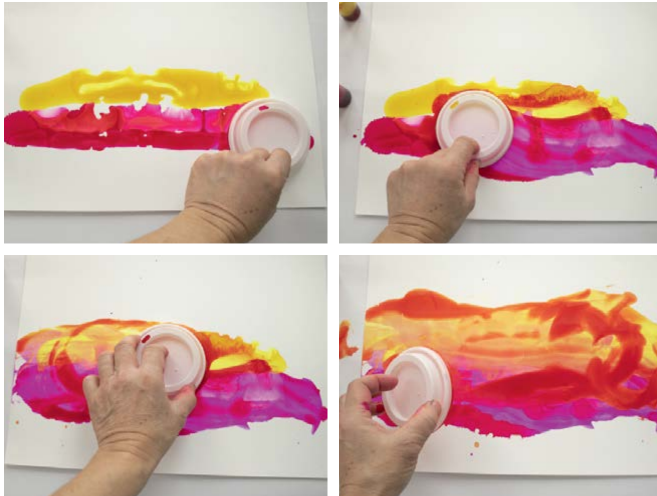
3. Trascinate e spostate sul foglio gli inchiostri e la soluzione con il coperchio di un bicchierino da caffè.