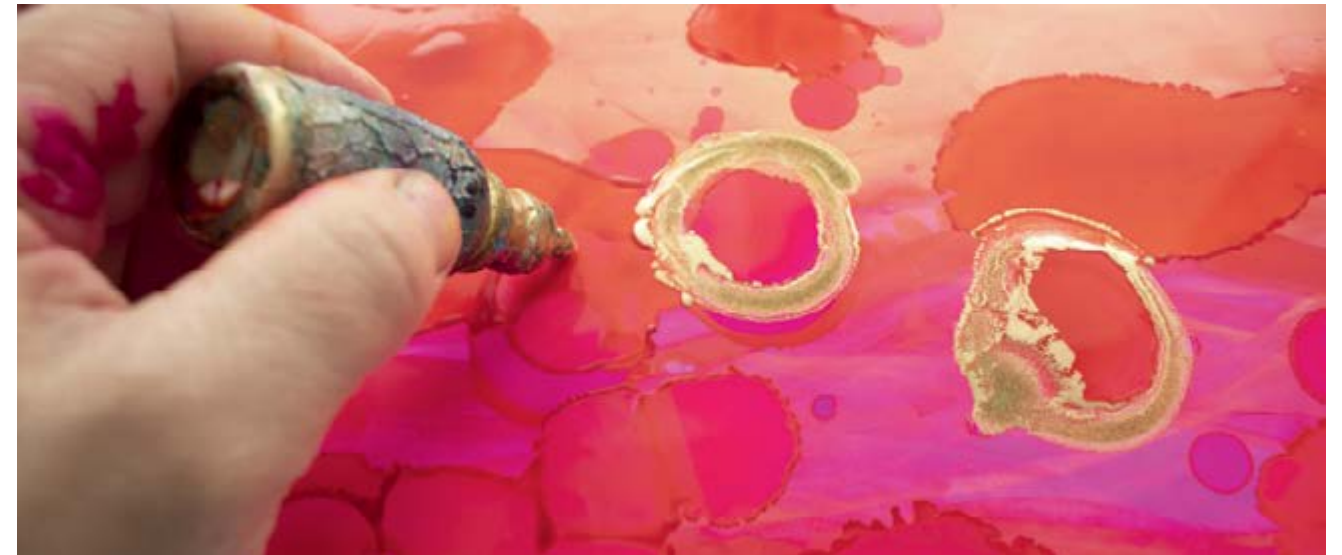
5. Utilizzate la punta del flacone come strumento per muovere o trascinare gli inchiostri sulla carta Yupo. Lasciate gocciolare l'inchiostro o usate un contagocce per aggiungere un altro elemento al dipinto. Se usate i colori metallici, scuotete bene i flaconi prima di sgocciolare gli inchiostri sul lavoro.