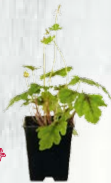
1 cespo di tiarella ( Tiarella )