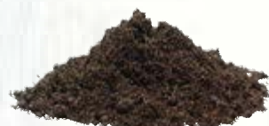
20 litri di terriccio da giardino