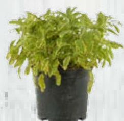
1 cespo di salvia dorata