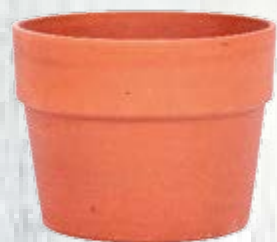
1 vaso di plastica da 30 cm di diametro, tanto largo quanto alto, col fondo forato