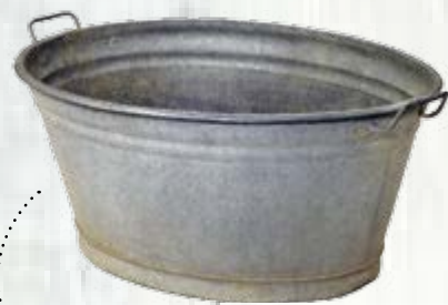
1 mastello di zinco rotondo od ovale da 40 cm di diametro o 50 cm di lunghezza, forato