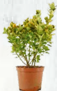
2 evonimo variegato ( Euonymus japonicus )