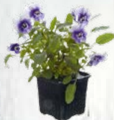
2 vasetti di viola azzurro cielo a cuore nero e bianco ( Viola cornuta )