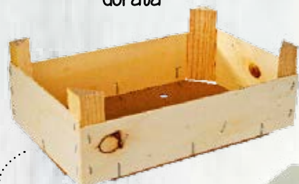
1 cassetta di legno da mercato