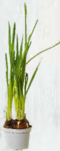
8 vasetti di narciso bianco ( Narcissus )