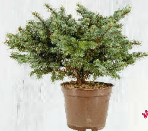
1 abete nano blu ( Picea pungens 'Glauca Globosa')