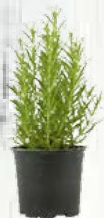
1 cespo di rosmarino