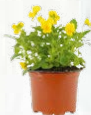
2 vasetti di viola gialla ( Viola cornuta )