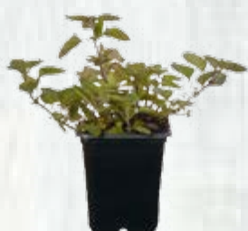
1 cespo di origano