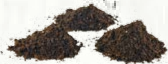
15 litri di terriccio per piante aromatiche