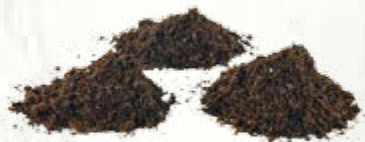
40 litri di terriccio per vasi e fioriere