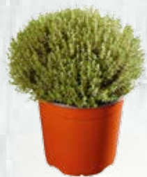
1 cespo di timo