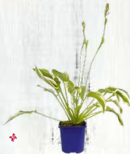
1 hosta variegata ( Hosta 'Wide Brim')