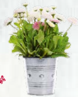
2 vasetti di pratolina bianca ( Bellis perennis )