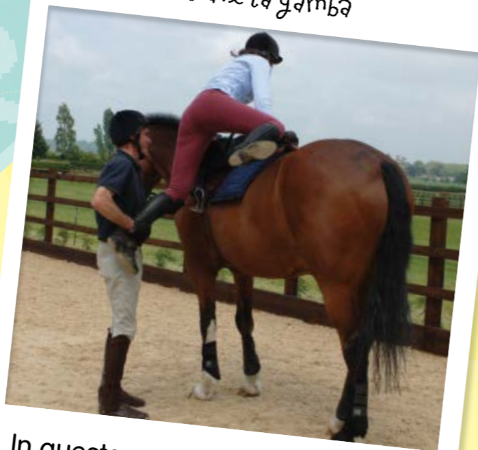
Dare la gamba

In questo caso chiedete a qualcuno di tenervi la parte inferiore della gamba sinistra. Poi, quando siete pronti, potrà spingervi verso l'alto mentre alzate la gamba destra.