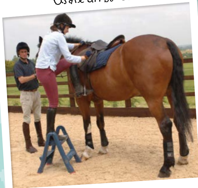
Usare un blocco

Salire su un blocco aiuta quando il cavallo è alto o in caso non abbiate molto slancio. Inoltre evita di stratonare la sella mentre si sale in groppa.