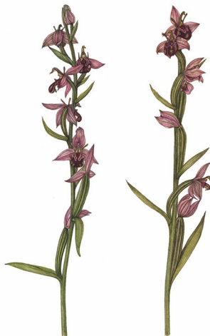
Dianus VESPARIA Ophrys sphegata