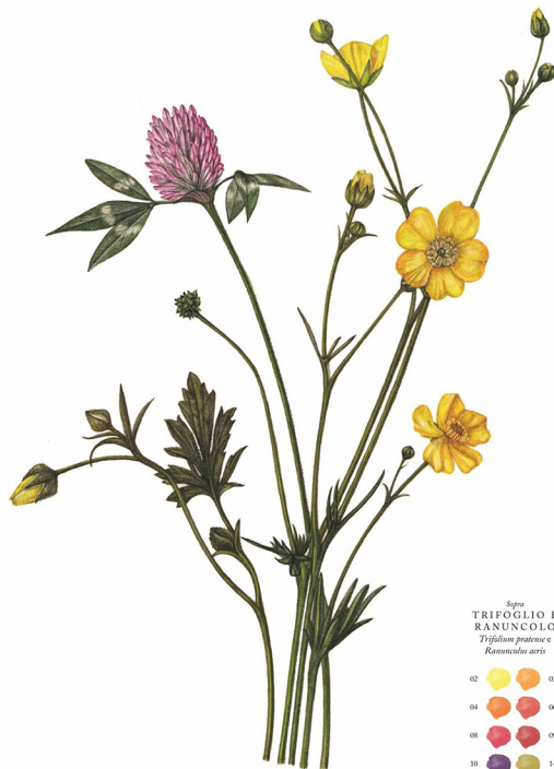
Sisium TRIFOLIO E RANUNCOLO Trifolium pratense e Ranunculus acris