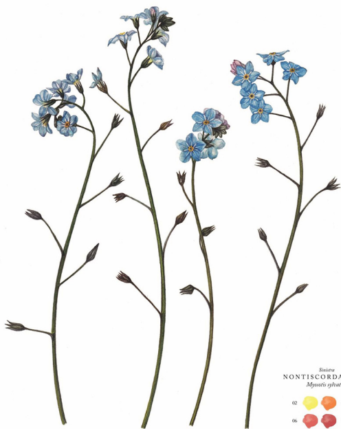
Sisima NONTISCORDARDIMÉ Myosotis sylvatica