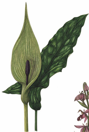
Sisium GIGARO SCURO Arum maculatum