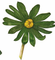
Sisima PIÈ DI GALLO Eranthis hyemalis