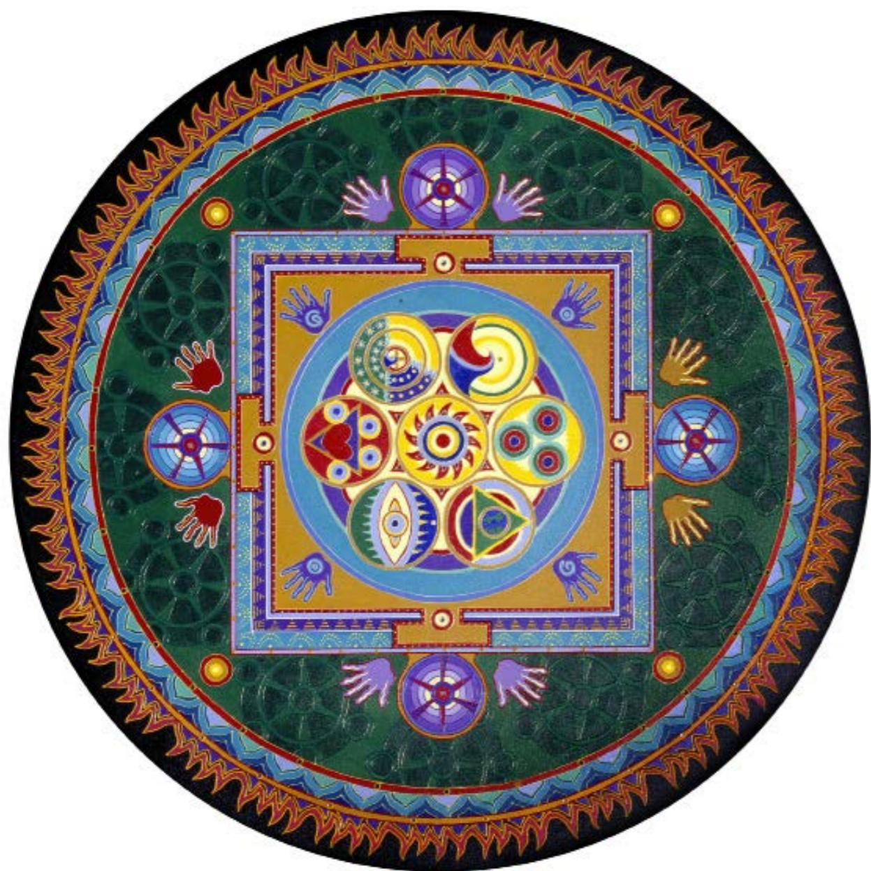
Sfuggito di mano