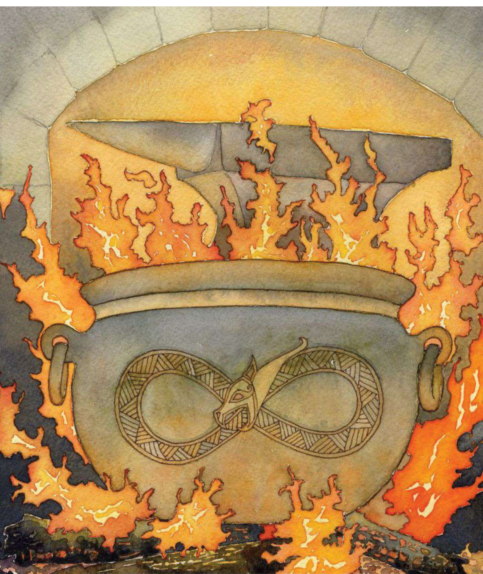
Asso di Fuoco