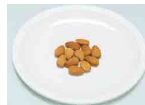
Mandorle = n. 12-14