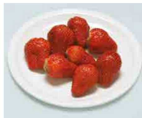
Fragole (7-8 pezzi)