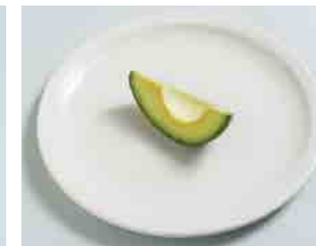
Avocado (1/4 di frutto) 70 g = 160 Kcal

Pezzi piccoli porzione da 150 g = 50 Kcal