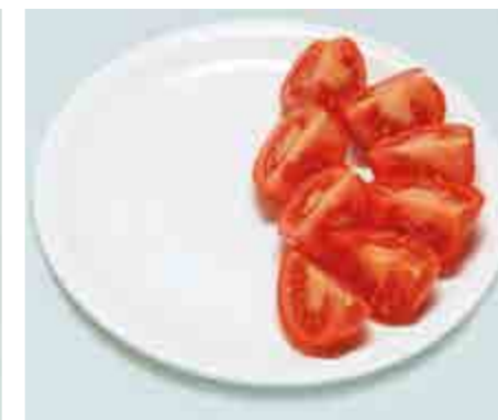
Pomodori = 200 g