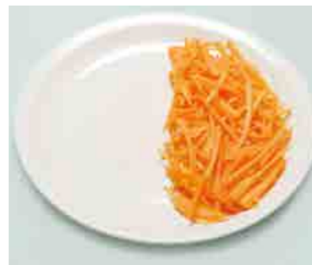
Carote julienne = 80 g