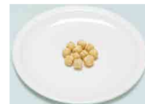
Nocciole = n. 10 -11