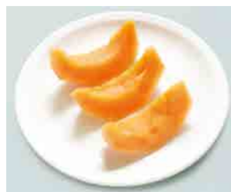
Melone (3 fette)