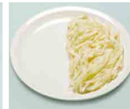
Finocchi crudi = 80 g