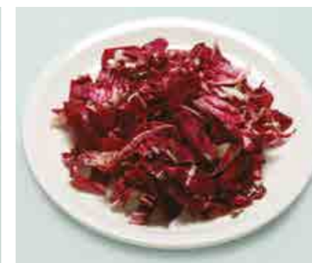
Insalate a foglia = 50 g