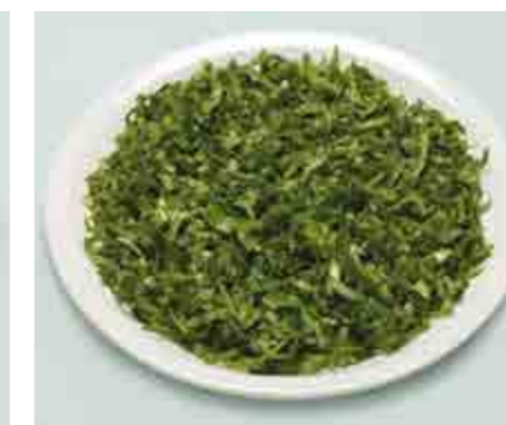
Insalata striscioline = 50 g