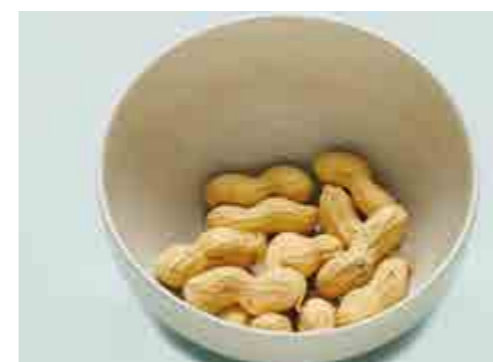
Arachidi = n. 11-12 intere

Misurate la porzione con il cucchiaino o contate i pezzi. La porzione illustrata nelle fotografie corrisponde a 15 g = 90 Kcal