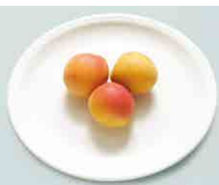
Albicocche (3 pezzi)