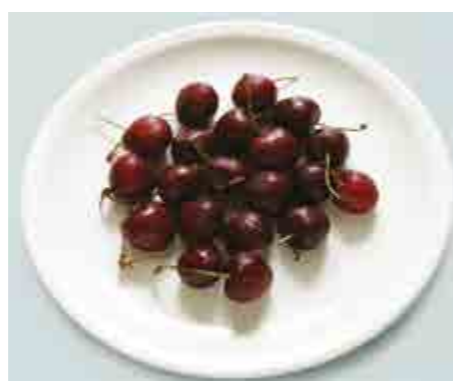
Ciliegie (20 pezzi)