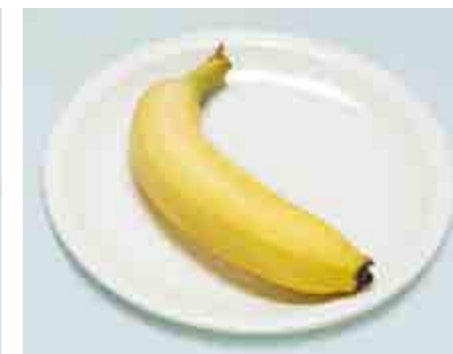
Banana (1 spanna) 100 g = 60 Kcal