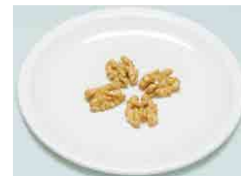
Noci = n. 2 intere