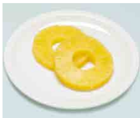
Ananas (2 fette)