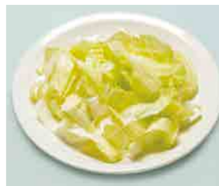
Insalate a foglia = 50 g