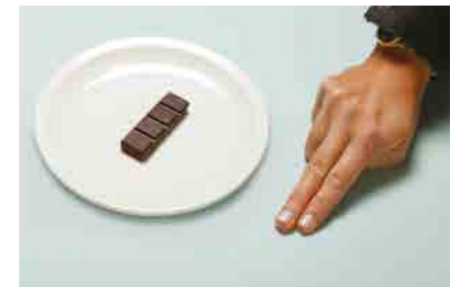
Le dita possono essere usate come riferimento per alimenti riducibili in piccoli pezzi, come il cioccolato o una fetta di torta, o anche il formaggio