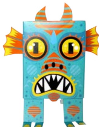
MOSTRO DEL LAGO