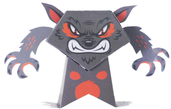
il lupo mannaro