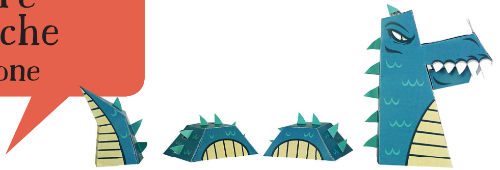
il mostro di Loch Ness