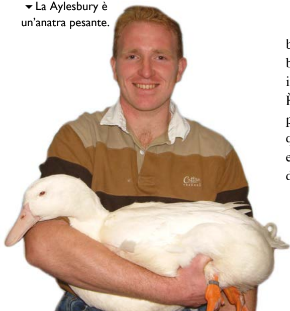
▼ La Aylesbury è un'anatra pesante.

Poche anatre bianche appartengono davvero a questa razza. Una Aylesbury pura ha gli occhi azzurri e un caratteristico becco rosa. Le gambe sono arancioni. Se ha il becco arancione probabilmente si tratta di un incrocio con una Pechino, un uccello da carne. È un'anatra di grandi dimensioni: il maschio può arrivare a 5,6 kg. È calma e ama mangiare, quindi assicuratevi che abbia spazio per fare esercizio o ingrasserà (importante per le anatre da compagnia). Depone 25 – 100 uova l'anno.