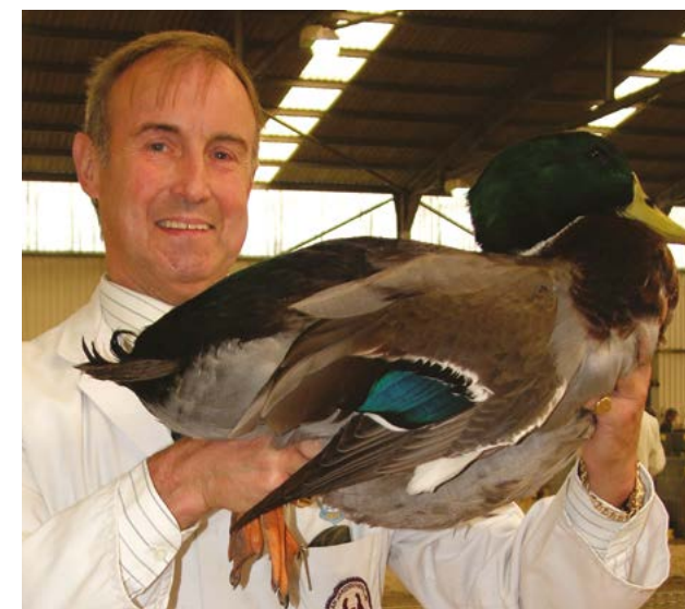
▲ Maschio di Rouen premiato.

Uccello tranquillo e maestoso originario della Francia. È considerato dagli ammiratori il più imponente tra le razze di grandi dimensioni. Ha una colorazione simile al Germano su un corpo ampio e quadrato e zampe corte e