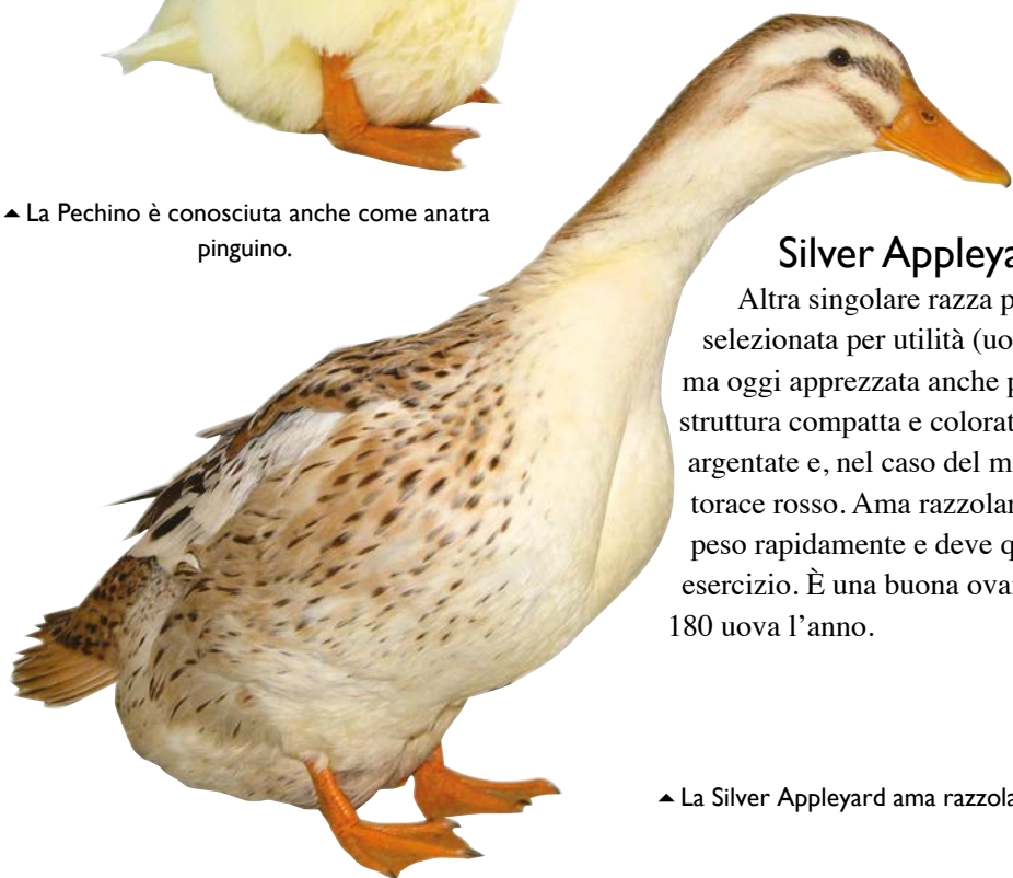
▲ La Silver Appleyard ama razzolare.

È una razza da carne. Anatra incantevole, tranquilla e amichevole, non è in grado di volare e ama pascolare in un terreno libero di dimensioni decorose alla ricerca di invertebrati. Buona ovaia, può deporre circa 100 uova l'anno. Ha un piumaggio molto aperto, quasi vaporoso, e non è quindi adatta a un contesto fangoso, oltre ad avere bisogno di acqua in abbondanza per mantenersi pulita. Il tipo piumaggio attira i parassiti e le uova di mosca. Buona madre, alleva con sollecitudine i propri anatroccoli.