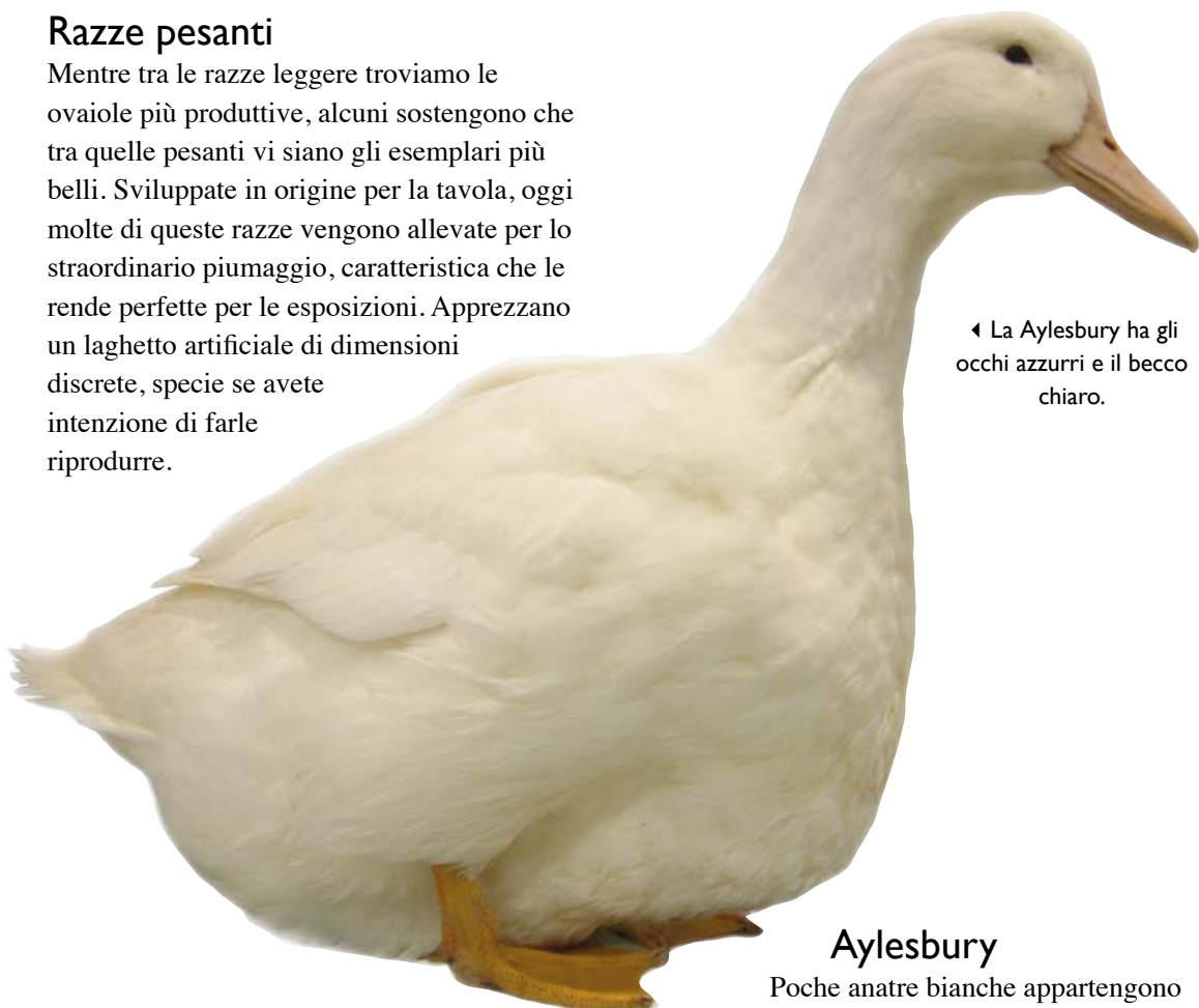
◀ La Aylesbury ha gli occhi azzurri e il becco chiaro.

Mentre tra le razze leggere troviamo le ovaiole più produttive, alcuni sostengono che tra quelle pesanti vi siano gli esemplari più belli. Sviluppate in origine per la tavola, oggi molte di queste razze vengono allevate per lo straordinario piumaggio, caratteristica che le rende perfette per le esposizioni. Apprezzano un laghetto artificiale di dimensioni discrete, specie se avete intenzione di farle riprodurre.