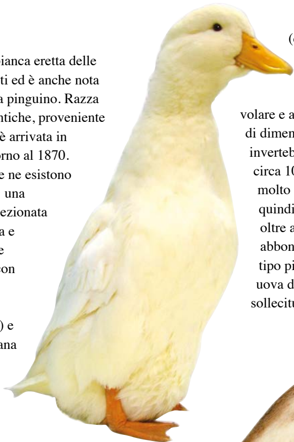
▲ La Pechino è conosciuta anche come anatra pinguino.

È l'anatra bianca eretta delle razze pesanti ed è anche nota come anatra pinguino. Razza di origini antiche, proveniente dalla Cina, è arrivata in Europa intorno al 1870. Attualmente ne esistono due varietà: una tedesca (selezionata in Germania e Inghilterra e più eretta, con piumaggio bianco giallognolo) e una americana