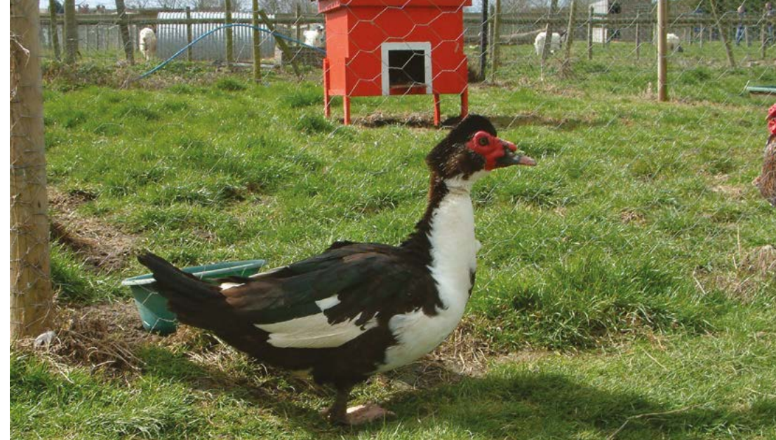
▲ L'anatra muschiata è un'ottima volatrice.

Altra singolare razza pesante selezionata per utilità (uova e carne), ma oggi apprezzata anche per la struttura compatta e colorata con punte argentate e, nel caso del maschio, torace rosso. Ama razzolare, prende peso rapidamente e deve quindi fare esercizio. È una buona ovaia con 180 uova l'anno.