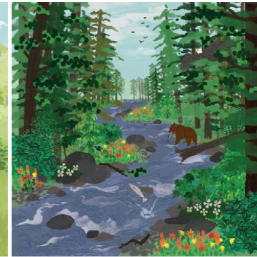
8. Tongass National Forest