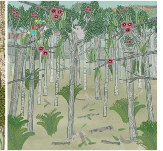
12. Boschetto di eucalipti