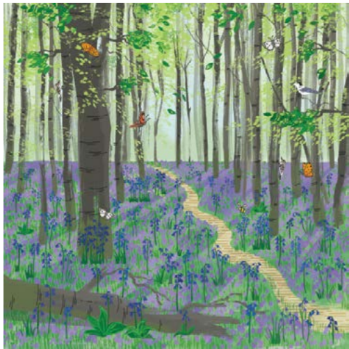
1. Bosco con campanule