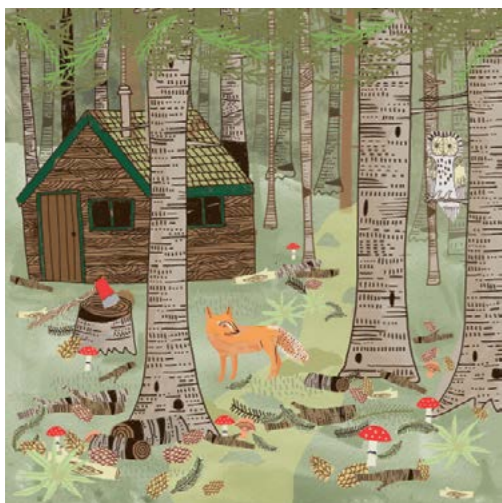
4. Foresta norvegese