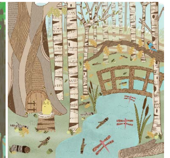
15. Bosco degli Orsi