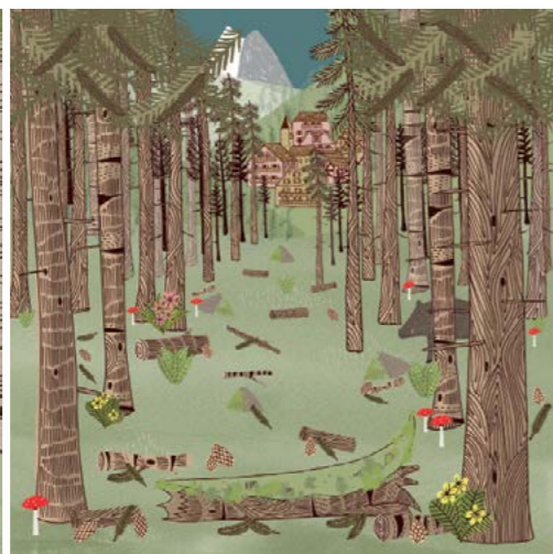
5. Foresta Nera