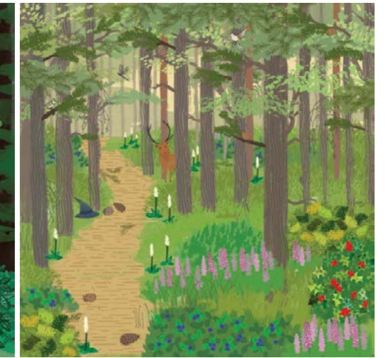
9. Caledonian Forest