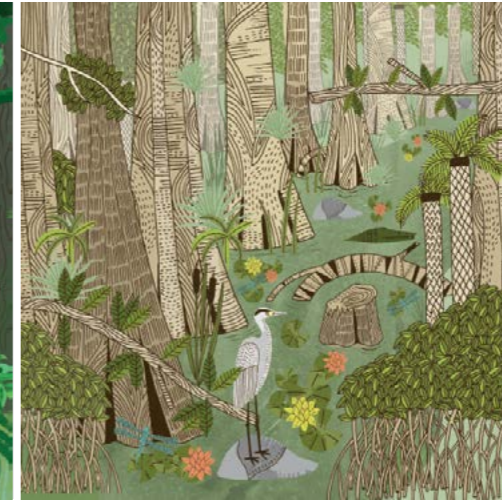
11. Florida Everglades