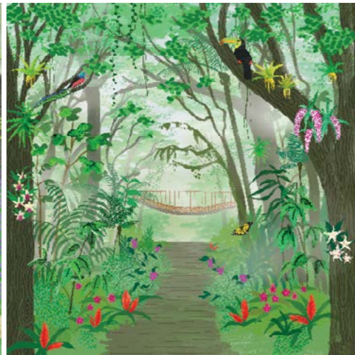
2. Foresta nebulare di Monteverde