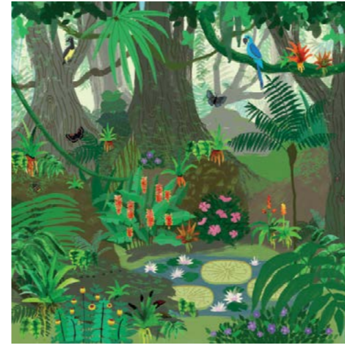
10. Foresta Amazzonica