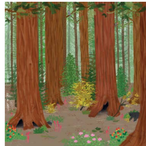
13. Sequoia National Park