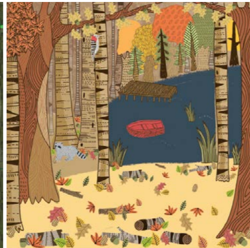
3. New England in autunno