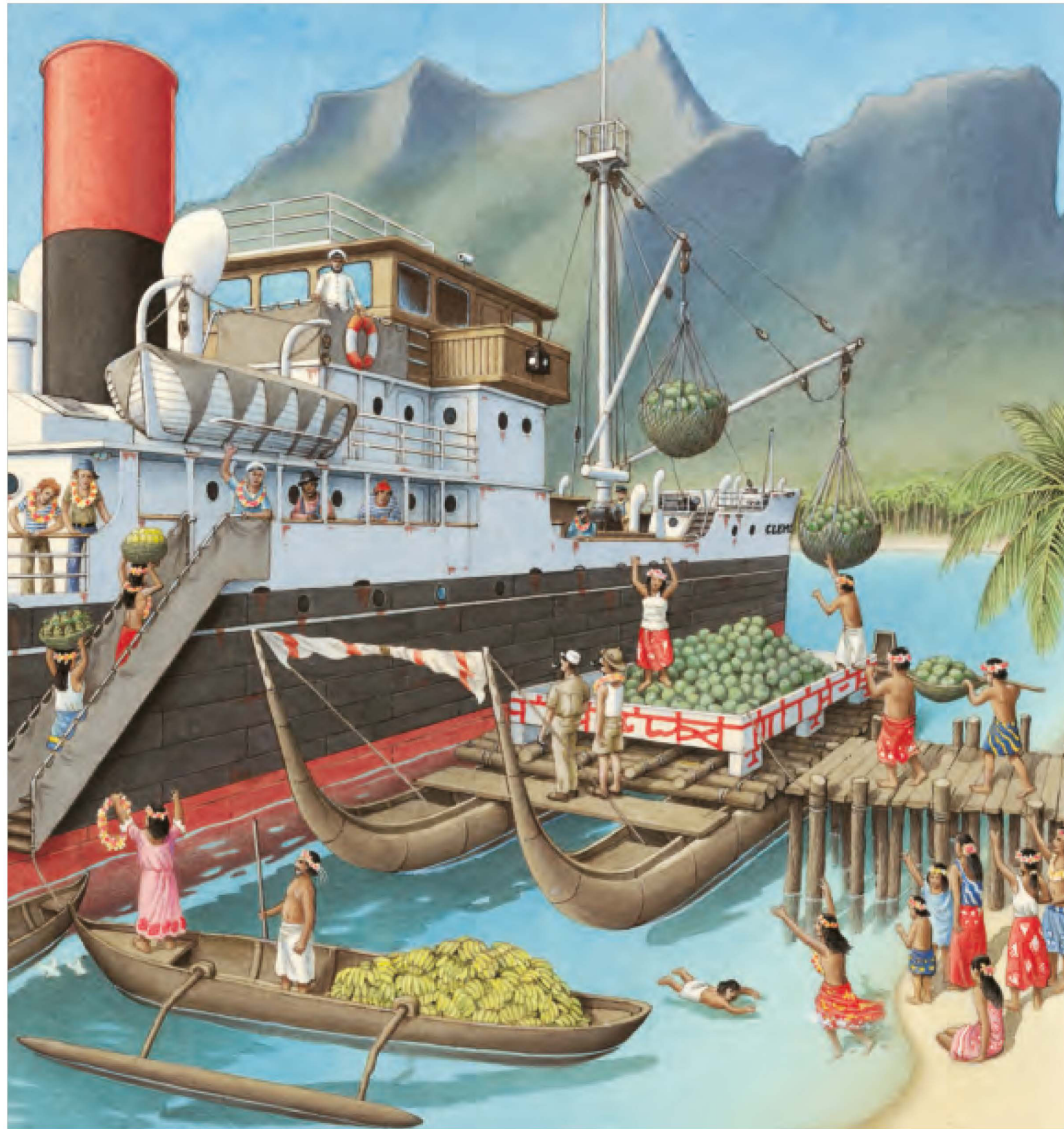
Riempivamo la sua stiva di frutta fresca.