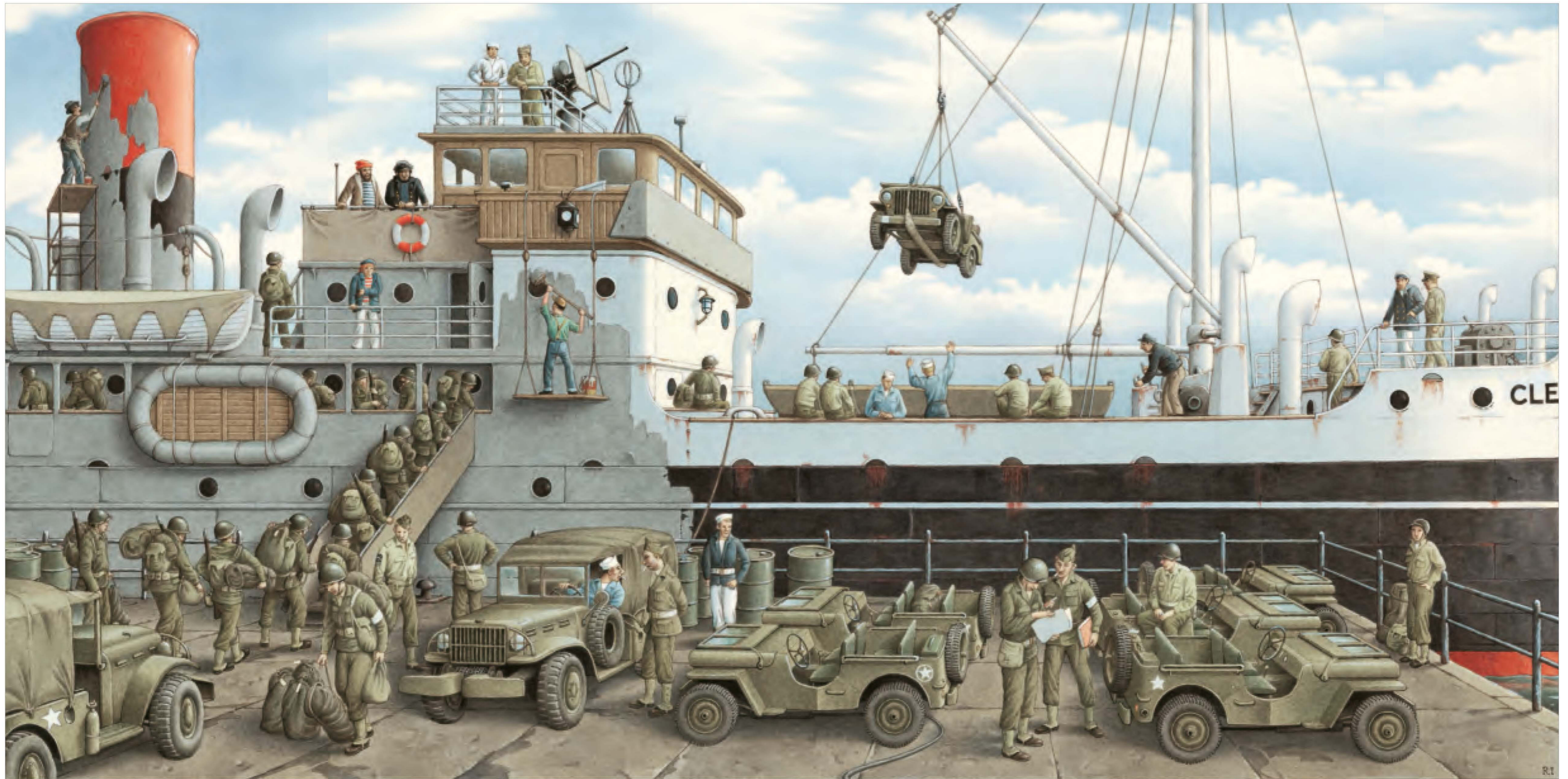
Clementine fu chiamata per servire la patria.