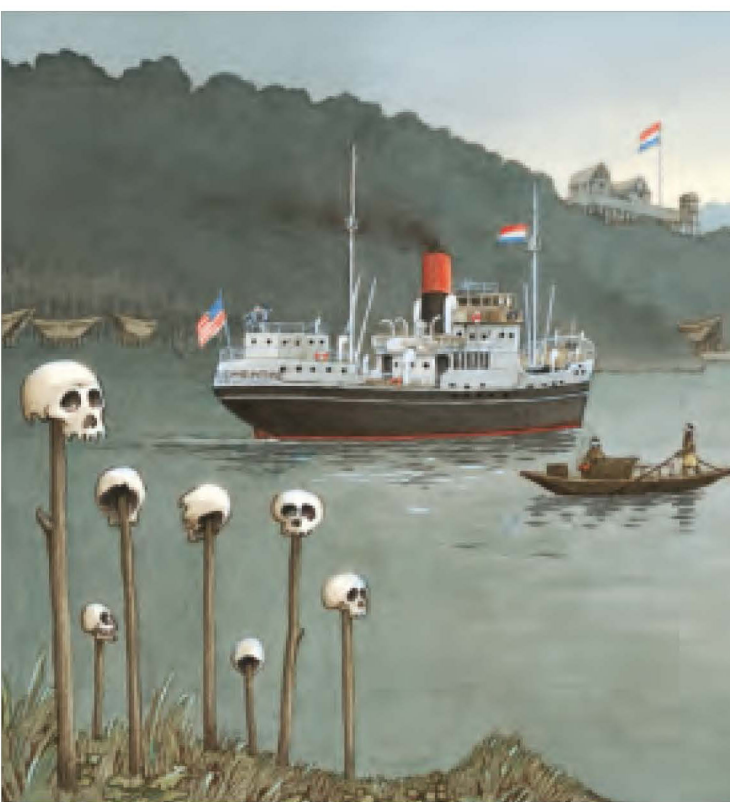
Gabbiani e delfini ci tenevano compagnia durante i lunghi viaggi.