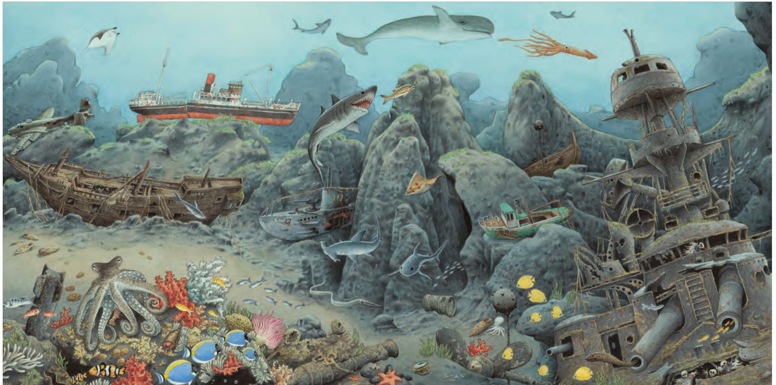
Il fondo del mare.