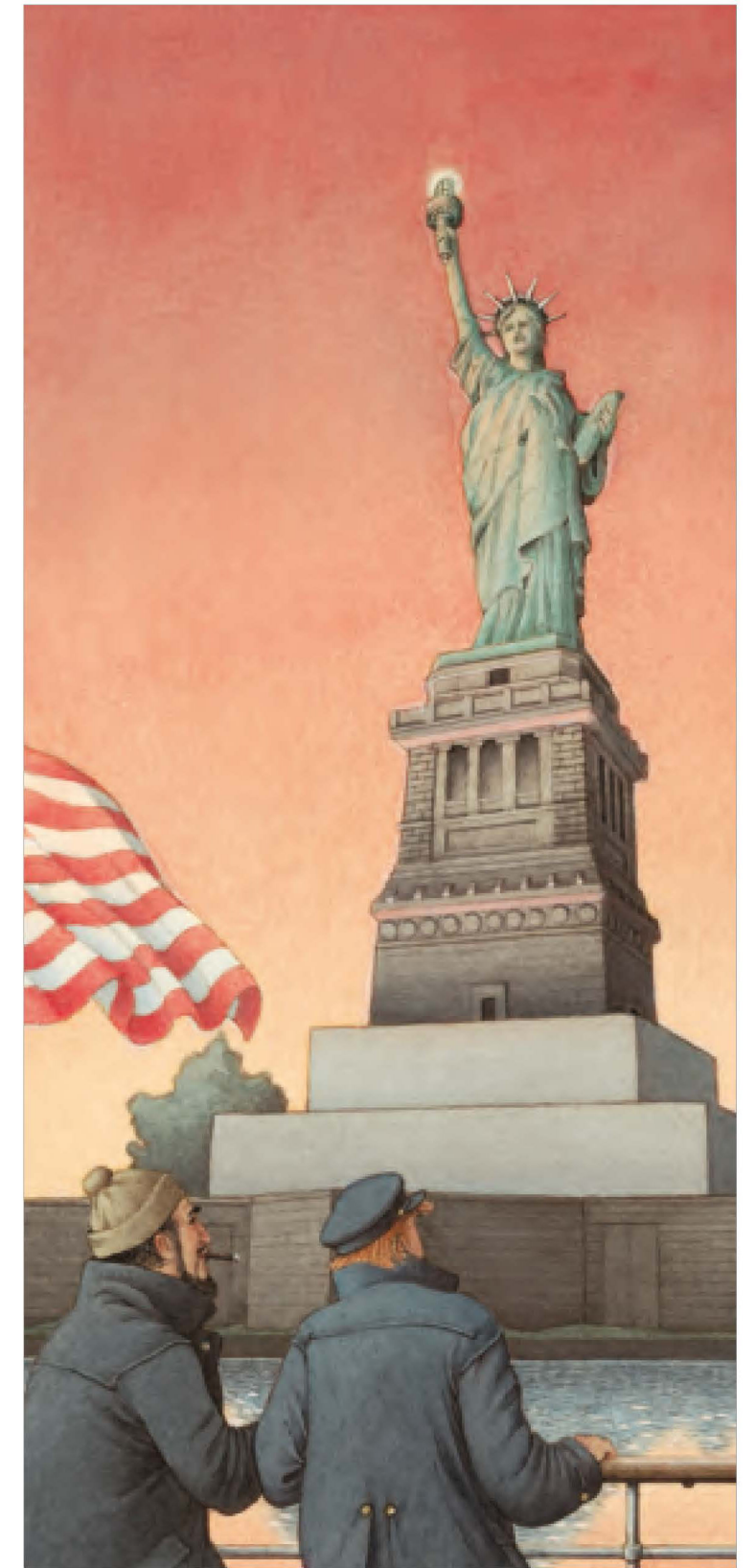
Ma nei porti, al ritorno, ci accoglievano volti familiari.