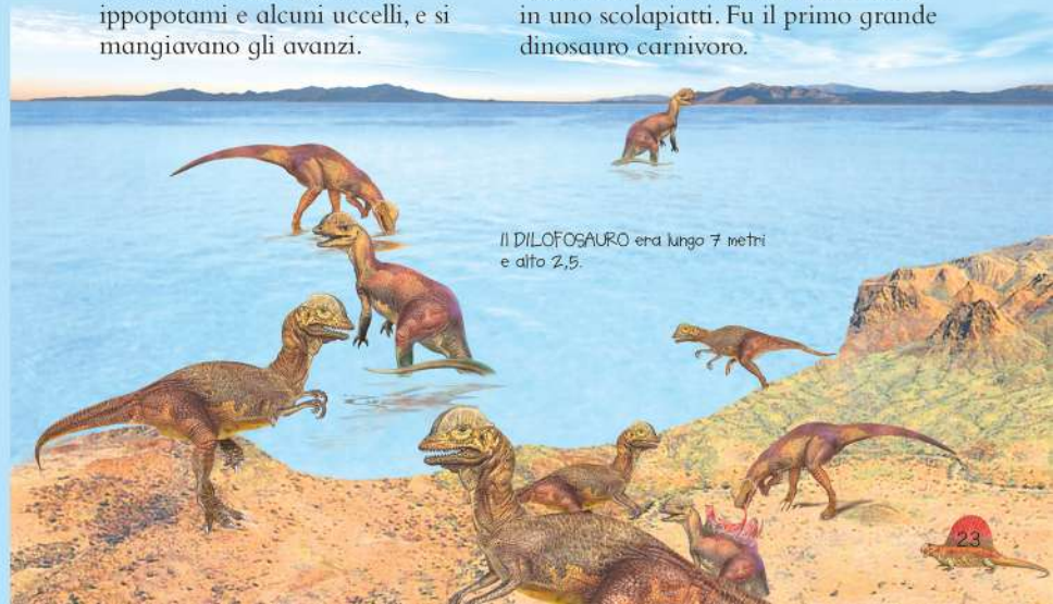
IL DILOFOSAURO era lungo 7 metri e alto 2,5.

Aveva in testa due ossa curve che sembravano due mezzi piatti infilati in uno scolapiatti. Fu il primo grande dinosauro carnivoro.