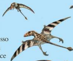
Le ali del DIMORFODONTE potevano raggiungere il metro di lunghezza.

Viveva vicino alle coste e volava basso a caccia di pesce. Alla fine della sua lunga coda ossea aveva un'appendice a forma di diamante che gli serviva come timone per muoversi e dirigere il volo.