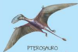
PTEROSAURO o "luce-tola alata".

Questi rettili volanti beccavano i brandelli di carne che rimanevano tra i denti dei grandi carnivori. Ce n'erano di piccoli come passeri e di enormi come aerei da turismo.