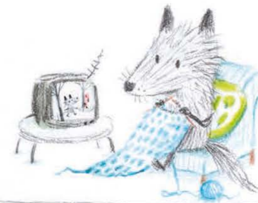
16:00 Lavoro a maglia